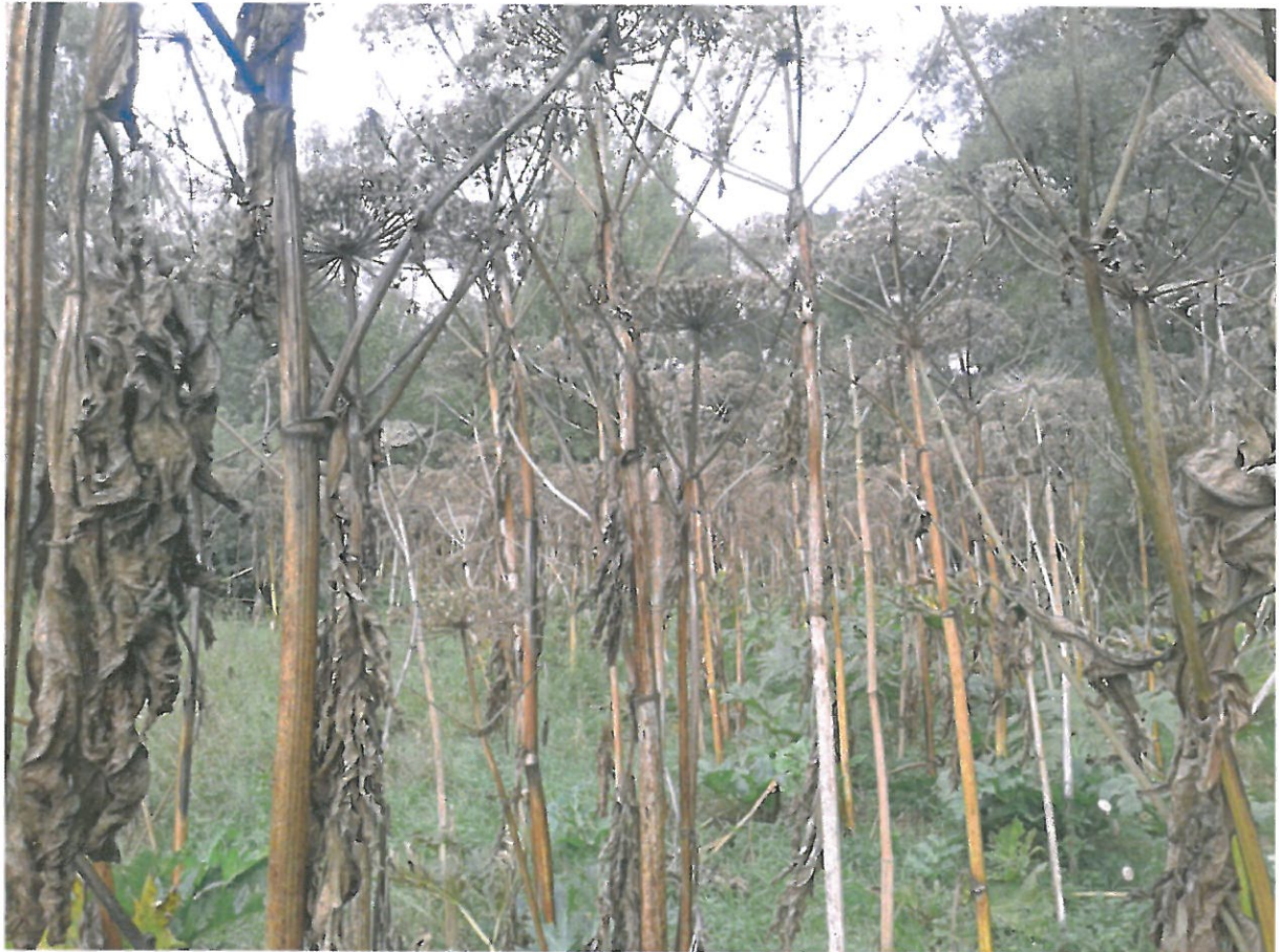
bolševník velkolepý ( Heracleum mantegazzianum )