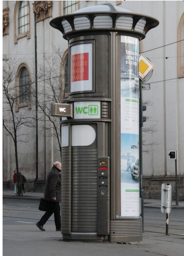
Možná náhrada stávajících toalet