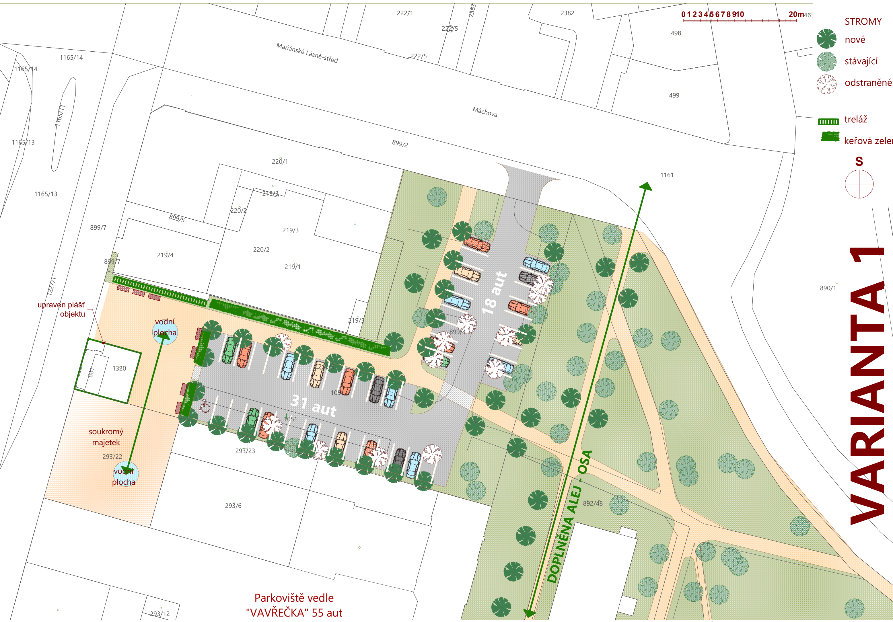
Parkoviště vedle "VAVŘEČKA" 55 aut