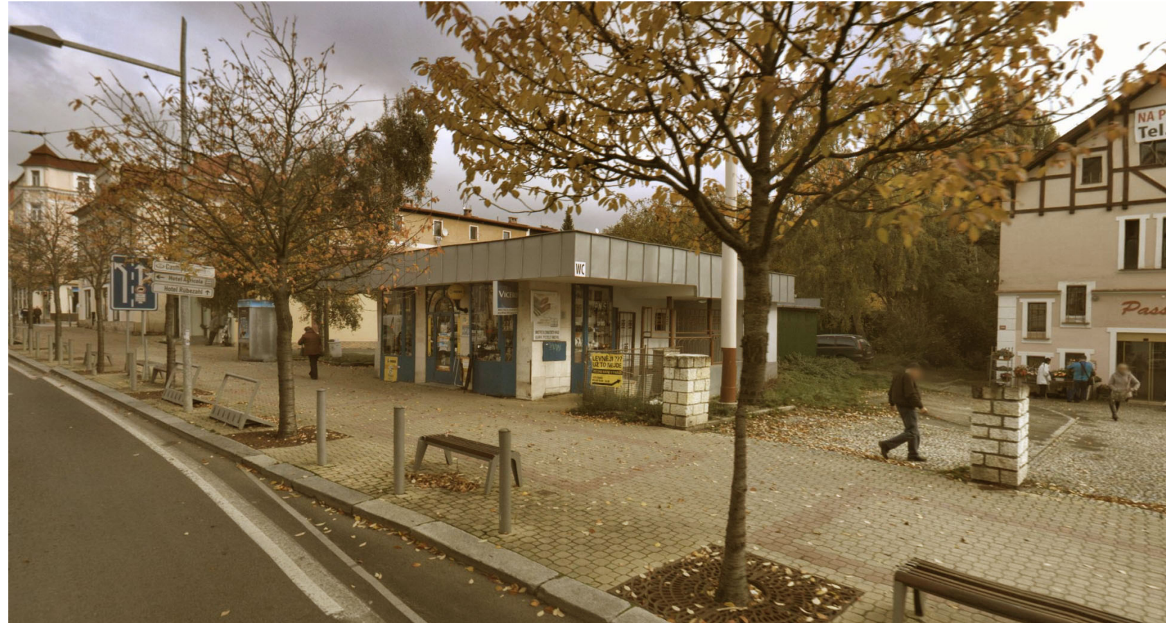
Možná náhrada stávajících toalet