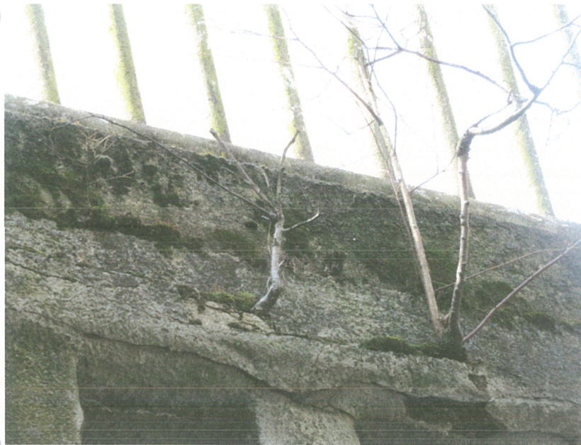
Pravá strana mostu. Zdivo poškozené náletovým porostem.