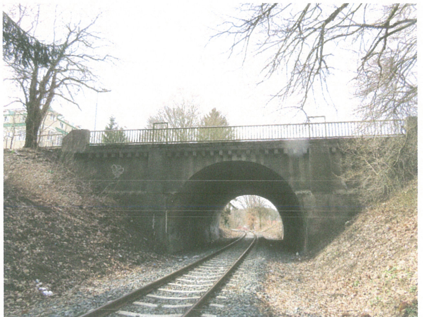
Pohled na most z pravé strany.